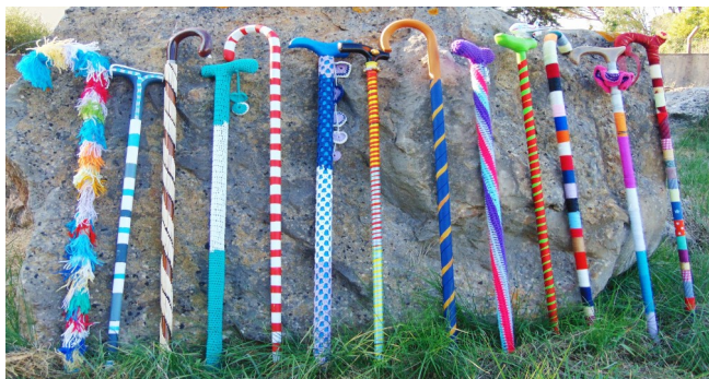
Bengalas decoradas por Residentes do ASAS